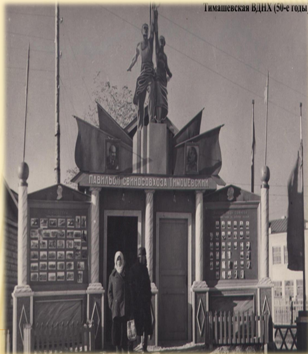
Тимашевская ВДНХ (50-е годы)