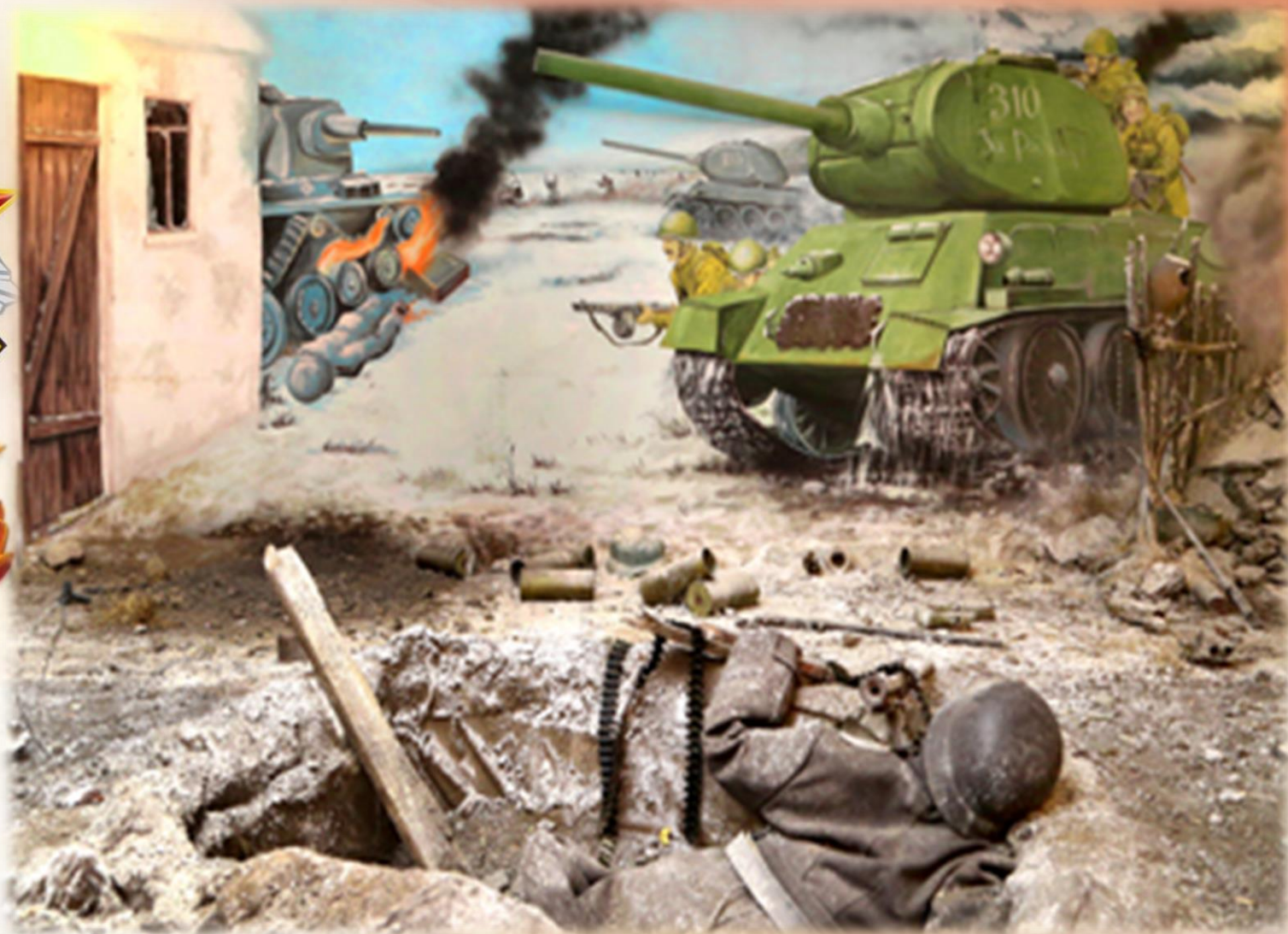
На фото фрагмент диорамы "Освобождение Тимашевского района" в музее семьи Степановых.