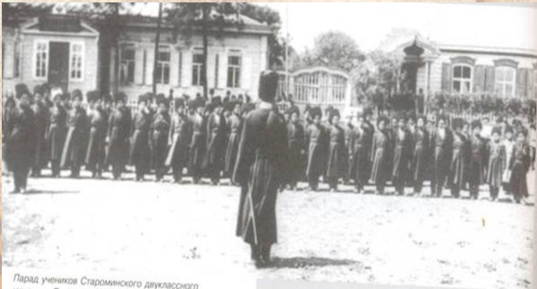
Парад учеников Староминского двухклассного