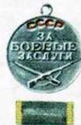
«За боевые заслуги»