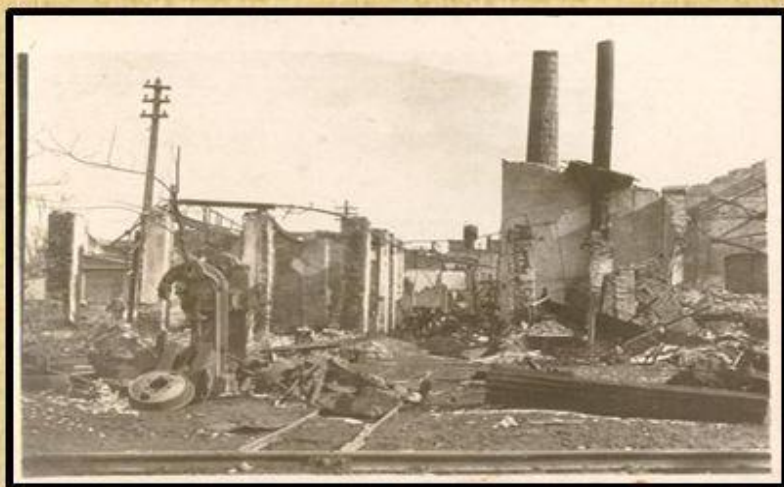
После оккупации. Нефтеперегонный завод в г. Краснодаре