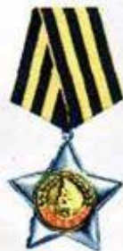
Орден Славы II степени