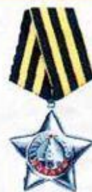
Орден Славы III степени