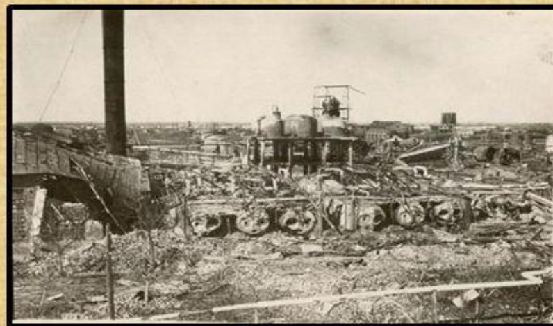
Завод им. Седина в г. Краснодаре после оккупации