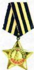
Орден Славы I степени