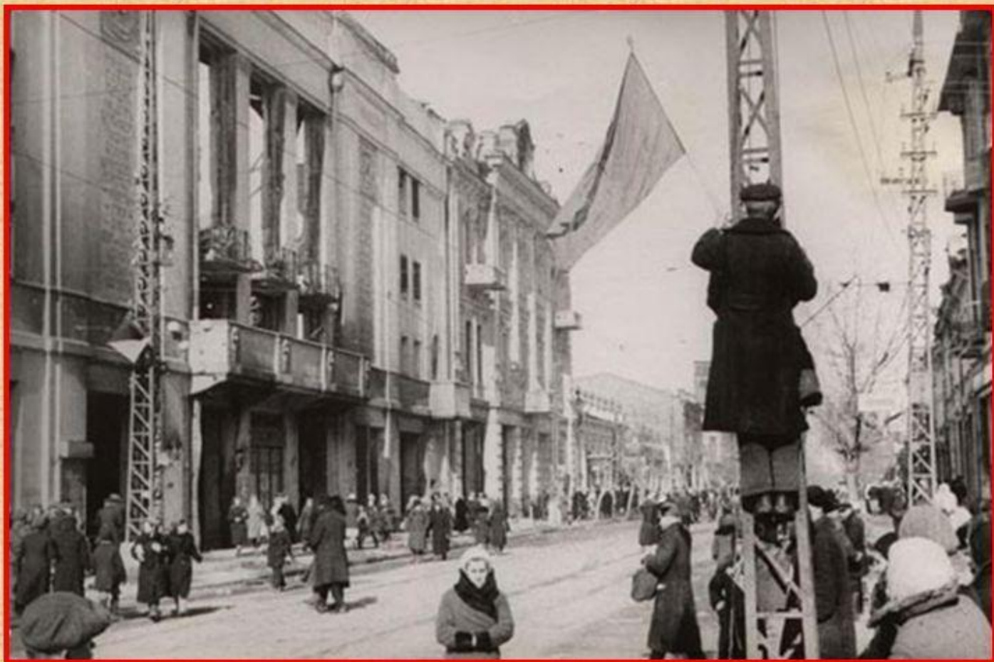
г. Краснодар. Улица Красная. Февраль 1943 г.