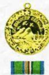
«За оборону Кавказа»